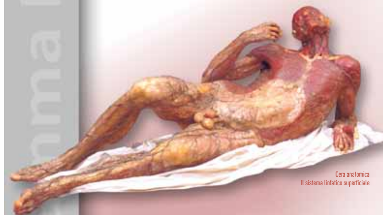
Cera anatomica Il sistema linfatico superficiale

lipedema, ulcere della gamba e del piede, diagnosi strumentale del linfedema